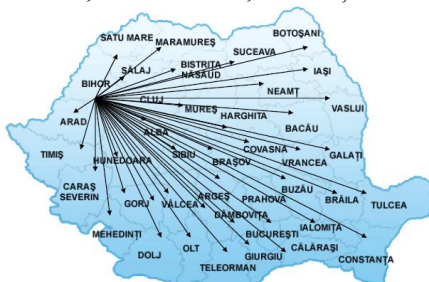
Fig. 2.1. Zonele de proveniență ale studenților

În prezent analizând locațiile de proveniență ale studenților noștri, putem afirma că aspirația regională a Universității AGORA a fost îndeplinită, ba chiar depășită, așa cum se observă pe harta următoare, referitoare la zonele de proveniență ale studenților noștri.