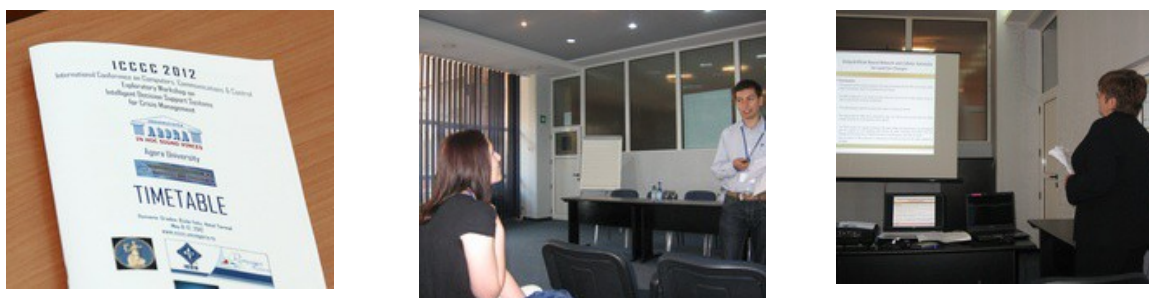
Foto 2. Imagini din timpul conferinței