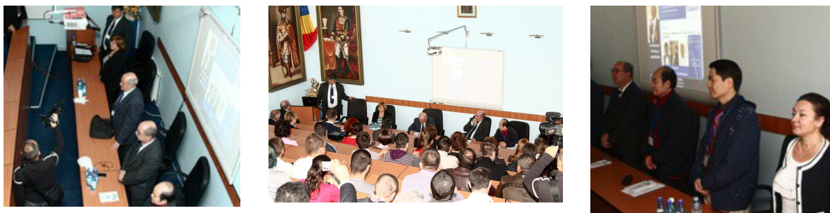
Foto 1. Imagini de la deschiderea festivă a IC CCC 2012