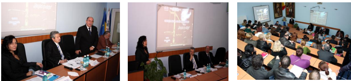
Foto 1. Imagini de la deschiderea festivă a AILC 2011