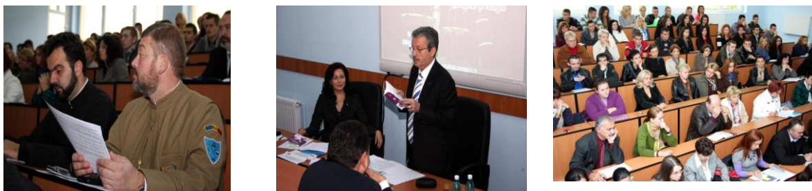
Foto 2. Imagini din timpul conferinței